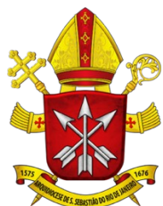
Dom Orani João Cardeal Tempesta, O.Cist. Arcebispo de São Sebastião do Rio de Janeiro

Río de Janeiro, 15 de septiembre de 2021.